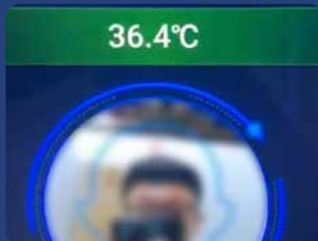
• Controlo da Temperatura com sinais visuais e auditivos