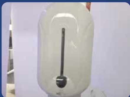
• Dispensador de Álcool Gel para Mãos